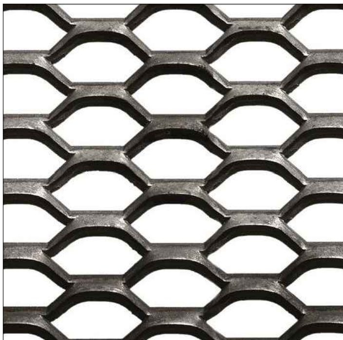
Schema d'orditura del pannello